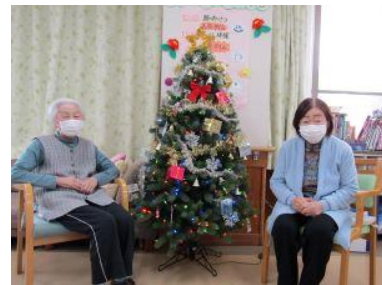
デイサービス職員：住吉

会報 竹の里ホーム Vol.97 令和5年1月号 (年4回発行 1・5・8・11月)