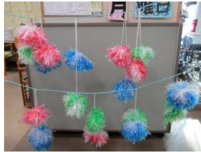
花火を打ち上げよう