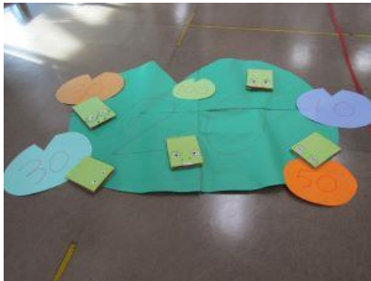
ぴよんぴよんガエル